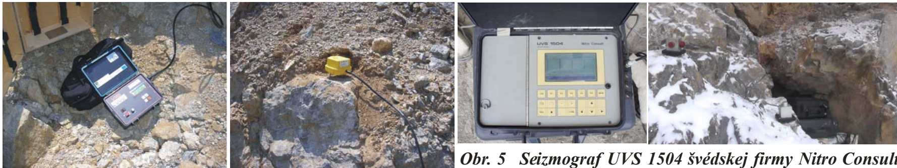
Obr. 4 Digitálny štvorkanálový seizmograf VMS 2000 MP firmy THOMAS INSTRUMENTS (vľavo). Trojzložkový seizmosnímač americkej firmy Geospace (vpravo) inštalovaný na podložke s oceľovými hrotmi meracie stanovisko 1