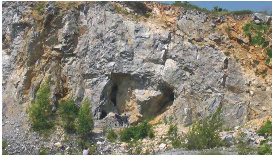
Obr. 2 Odkrytá časť Brekovskej jaskyne v lome Brekov v stene najvyššej ťažobnej etáže

Mezozoikum Humenských vrchov má z tektonického hľadiska polyštádiálny vývoj: najstaršie štádium deformácie sa v študovanom území nezachovalo, súviselo s vrchnokriedovo - severovergentným násunom križňanského príkrovu. Výsledkom mladšej (miocénnej) etapy je šupinovitá stavba ZSZ - VJV smeru so strmým úklonom k S resp. SV počas, ktorej došlo k rozčleneniu mezozoika na štyri tektonické šupiny (Jasenovská, Klakočiny,