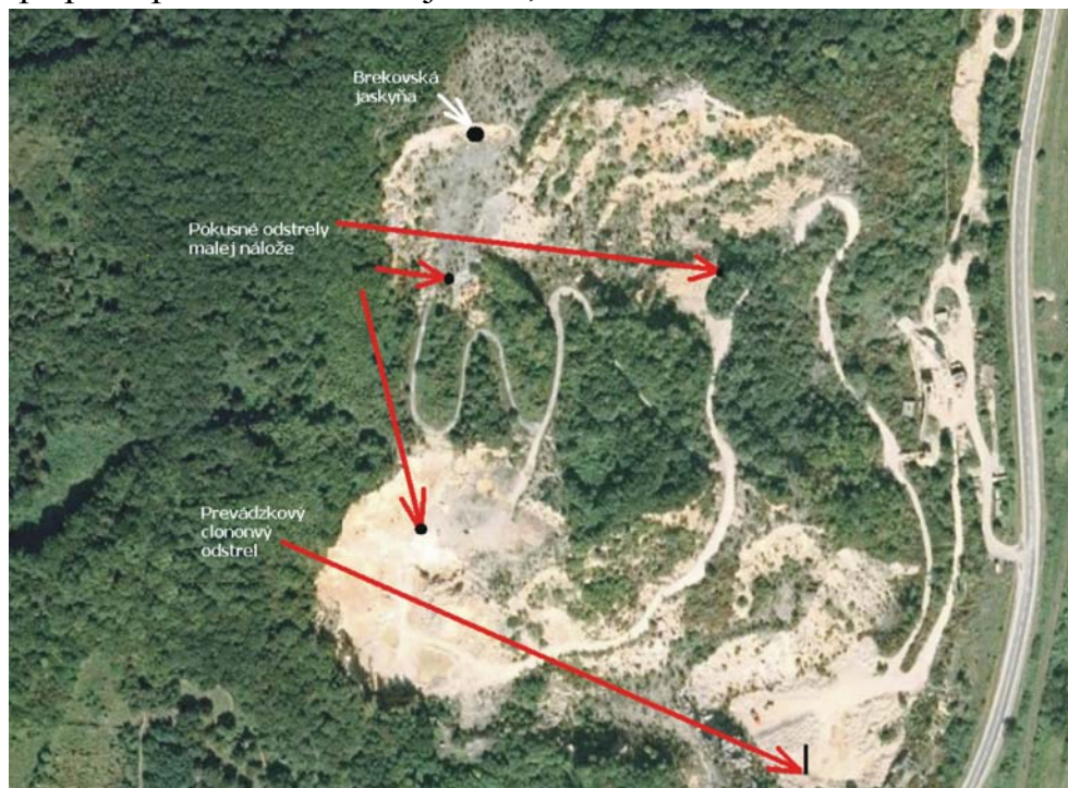
Obr. 3 Priestorová pozícia odstrelov voči meracím stanoviskám a Brekovskej jaskyni v lome Brekov

Pre posúdenie vplyvu technickej seizmicity na Brekovskú jaskyňu bol vypracovaný projekt seizmických meraní. V prípade posudzovania objektov, ktoré nie sú zahrnuté v STN 730036 je potrebné postupovať individuálne.