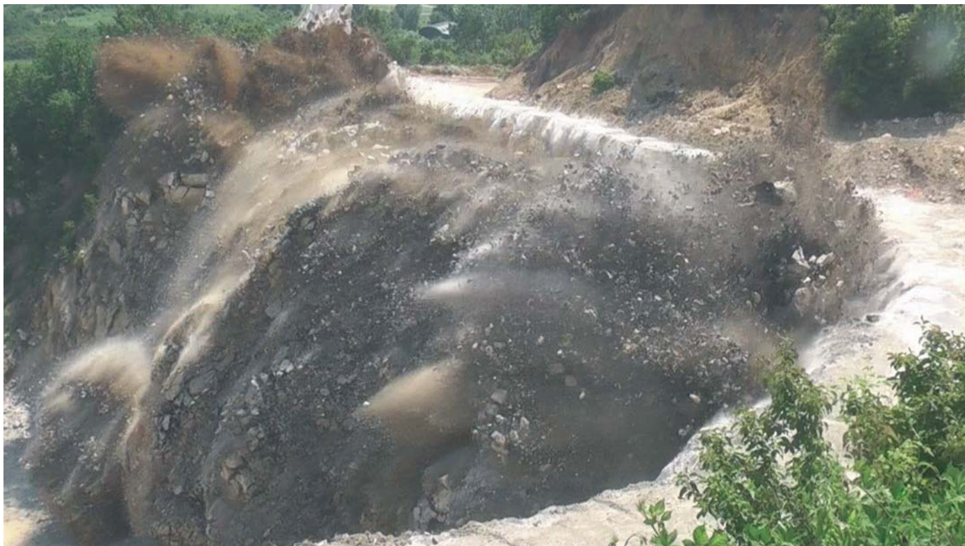
Obr. 6 Prevádzkový clonový odstrel CO 24 v lome Brekov situovaný vo vzdialenosti 376 m od Brekovskej jaskyne