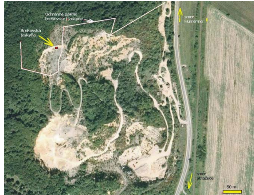
Obr. 1 Vystupovanie a pozícia Brekovskej jaskyne na úrovni IV. etáže (247 m n. m.) v lome Brekov. Zasahujúca hranica ochranného pásma (OP) Brekovskej jaskyne do dobývacieho priestoru

Humenské vrchy sú tvorené mezozoickými karbonátmi stredného triasu až strednej kriedy. Toto obdobie